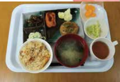
野菜をふんだんに使ったバランスの良いお食事を心を込めて作っております。