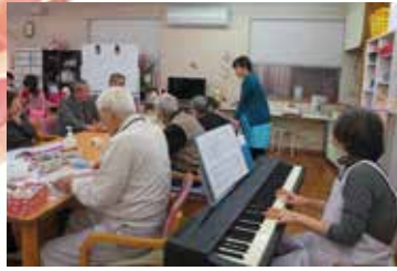
電子ピアノ演奏による音楽レク